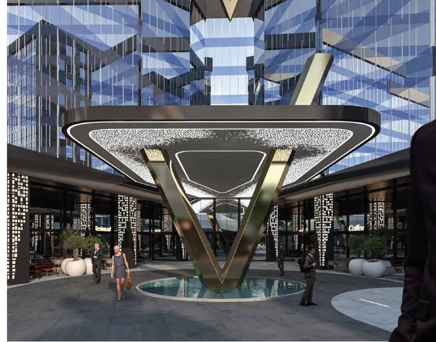
Görseller Tanıtım Amaçlıdır. Taahhüt Niteliği Taşımaz.